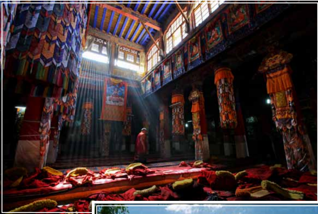
哲蚌寺大殿在早晨時份能夠看見攝影發燒友所謂的耶穌光。