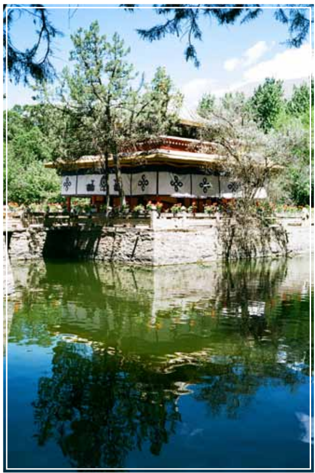
羅布林卡園林景色