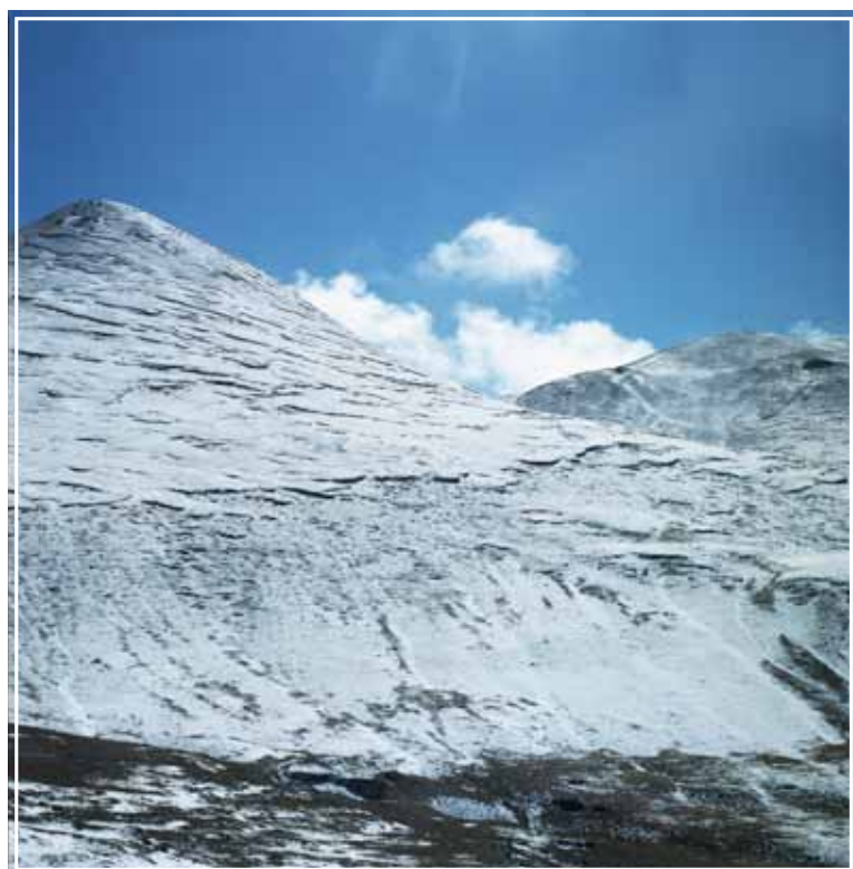
青藏鐵路--五道梁高原