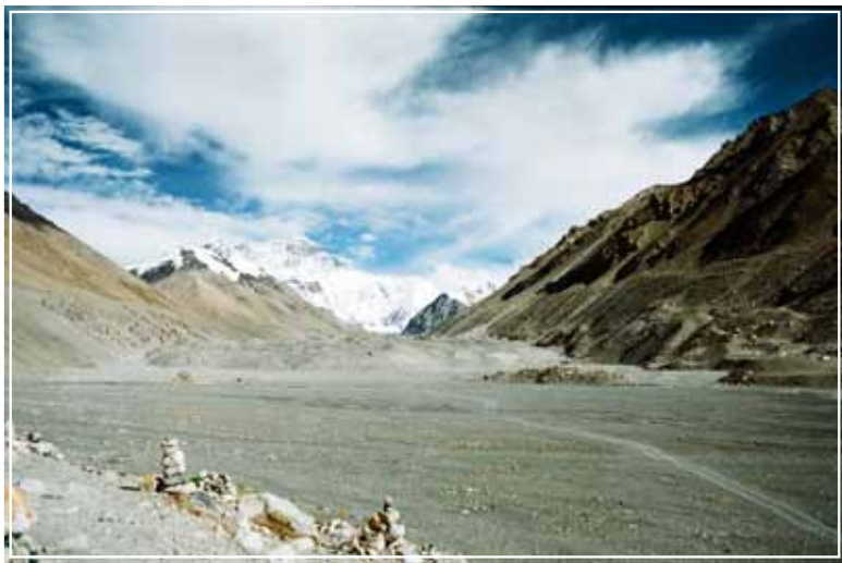
珠峰大本營的日景與黃昏