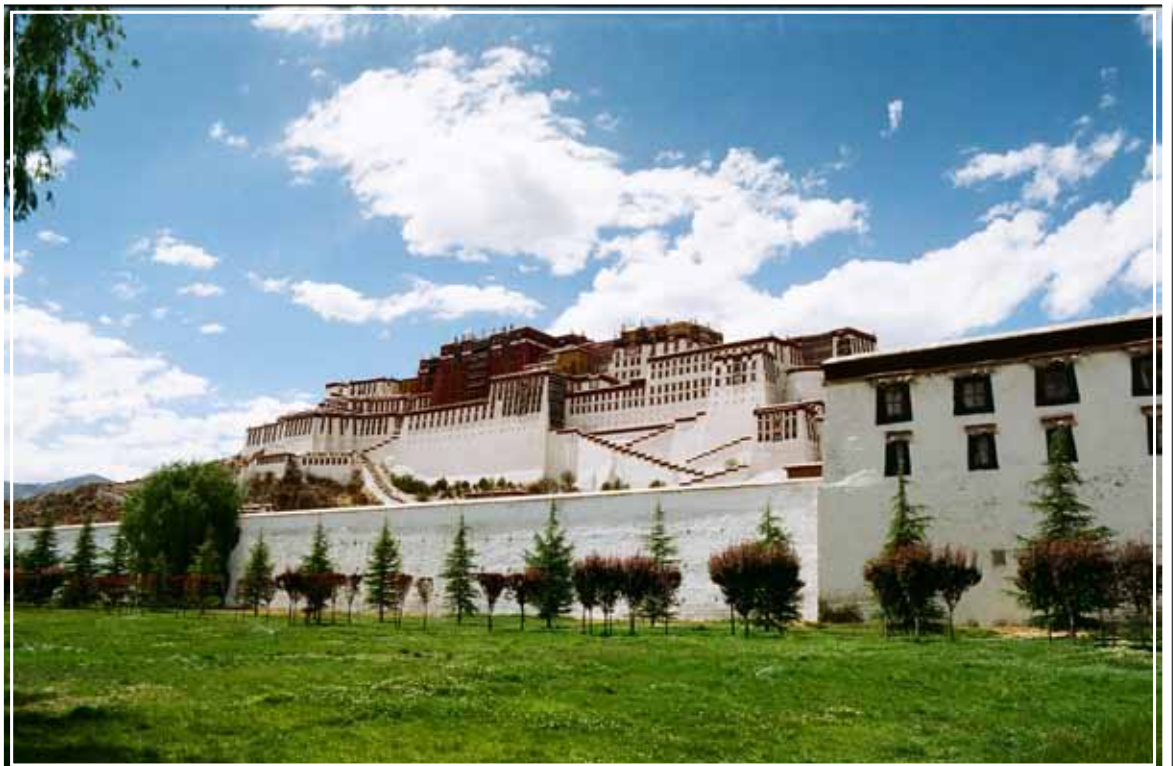
聞名中外的布達拉宮